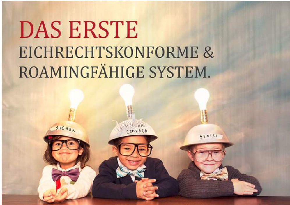
SAM macht Ladestationen fit - sicher, einfach, genial

100 Gramm Schinken, 15 Meter Kabel, 1 Liter Benzin: Normale Positionen auf unseren täglichen Einkaufszetteln, ihre korrekte Abrechnung wird von uns nicht in Frage gestellt - das Eichamt überprüft regelmäßig Waagen, Messtechnik, Zapfsäulen.